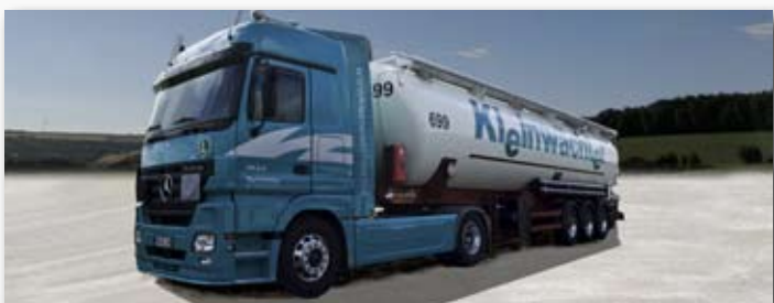
Kleinwächter GmbH & Co., 59969 Hallenberg