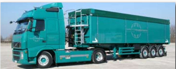
Knappkötter Transporte GmbH & Co. KG, 59494 Soest