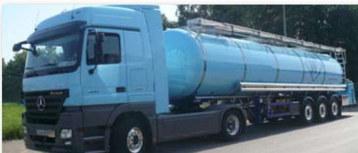
Werther Logistik, 31319 Sehnde