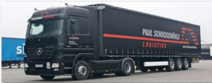
Paul Schockemöhle Logistics GmbH, 49439 Mühlen