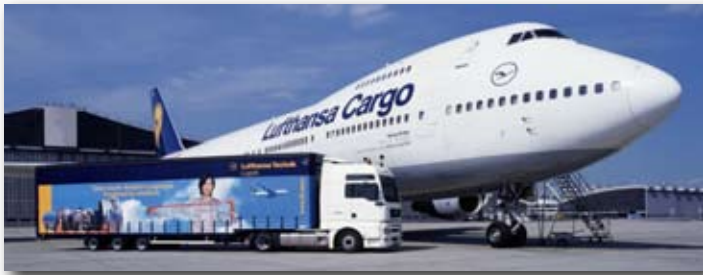
NLS Euro-Luftfracht-Service GmbH, 65451 Kelsterbach