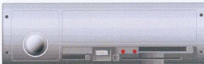
Das "TeleDrive Car Communication Terminal" mit Bordcomputer und Bildschirm wird im Rahmen des kostenlosen Tests im Fahrzeug eingebaut.

Interessierte Unternehmen können sich ab sofort beim Hersteller unter Tel. 06173-9979-0 melden. Es gibt keine Teilnahmevoraussetzungen außer der pfleglichen Behandlung der Testgeräte. Die Aktion